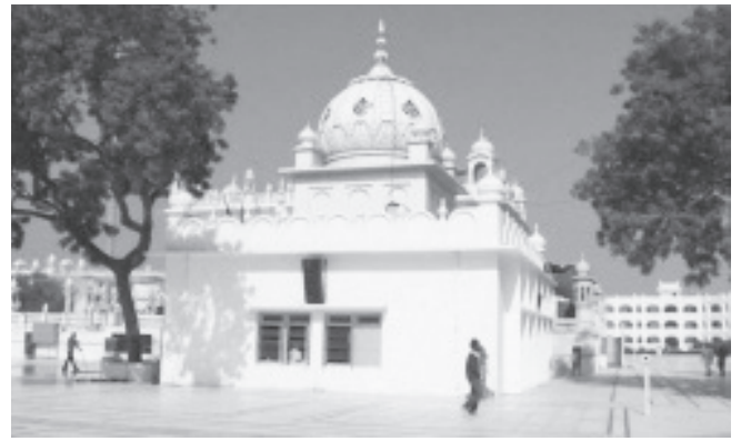
ਗੁਰਦੁਆਰਾ ਭਾਈ ਦਇਆ ਸਿੰਘ, ਔਰੰਗਾਬਾਦ (ਮਹਾਂਰਾਸ਼ਟਰ)

“ਰਹਤ ਏਹੀ ਹੈ ਜੋ ਮਸੀਦੀਏ, ਧੀਰਮਲੀਏ, ਰਾਮ ਰਾਈਏ, ਸਿਰ ਮੁੰਡਤ ਇਨ੍ਹਾਂ ਨਾਲ ਵਰਤਣਾ ਨਹੀਂ। ਸਿੰਘੋਂ ਕੀ